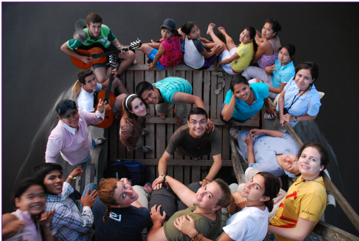
En el barco con el que visitamos las comunidades del Río Blanco

hay un maestro durante la primaria) que quieran seguir sus estudios.