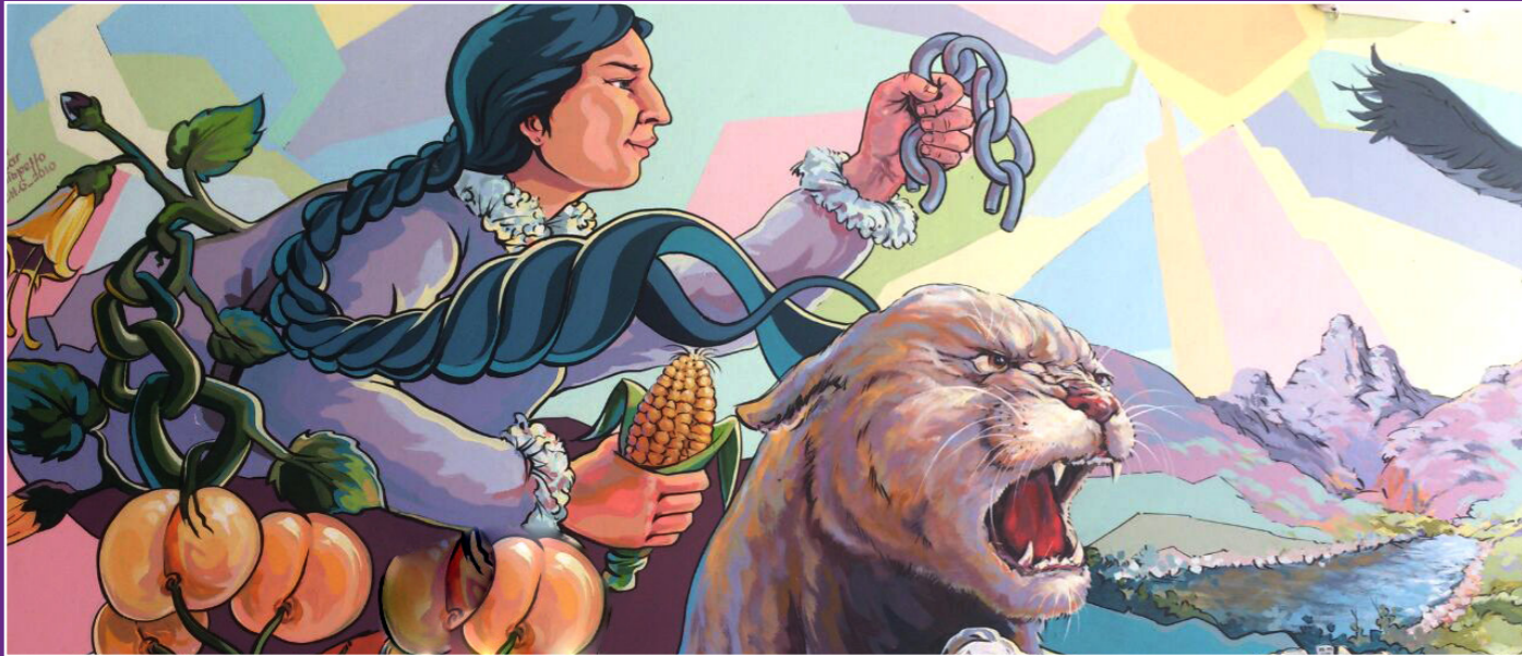
Fragmento de Mural en Terminal Terrestre de Abancay - Apurímac

-a menudo por occidente- como un problema al que hay que esconder, un motivo de vergüenza, asco e incluso algo patológico que hay que medicalizar. Esto tiene como consecuencia la desnaturalización de nuestra naturaleza cíclica, y en algunos casos problemas serios para la salud derivados de medicamentos para una enfermedad que no existe y que la cultura patriarcal ha creado para problematizar nuestro cuerpo. En algunas comunidades indígenas del Perú esta realidad es bien distinta, lo que demuestra su carácter de construcción para el sometimiento, el cuerpo de la mujer y con él el sangrado menstrual es considerado como algo sagrado y usado como unguento sanador tradicional.