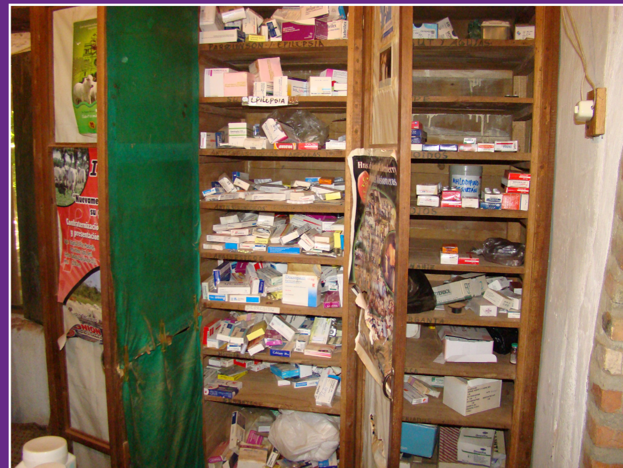
El estado inicial del dispensario

que problemas de salud. Al fin y al cabo, una persona que va a un consultorio en la Selva de Bolivia, y a una farmacia en Málaga, tienen el mismo problema supuestamente, la enfermedad. Mi futuro profesional no va a ser el mismo después de ver como el médico misionero que allí vive y mis compañeros médicos trataban a los pacientes, y esto es algo que no enseñan en las facultades.