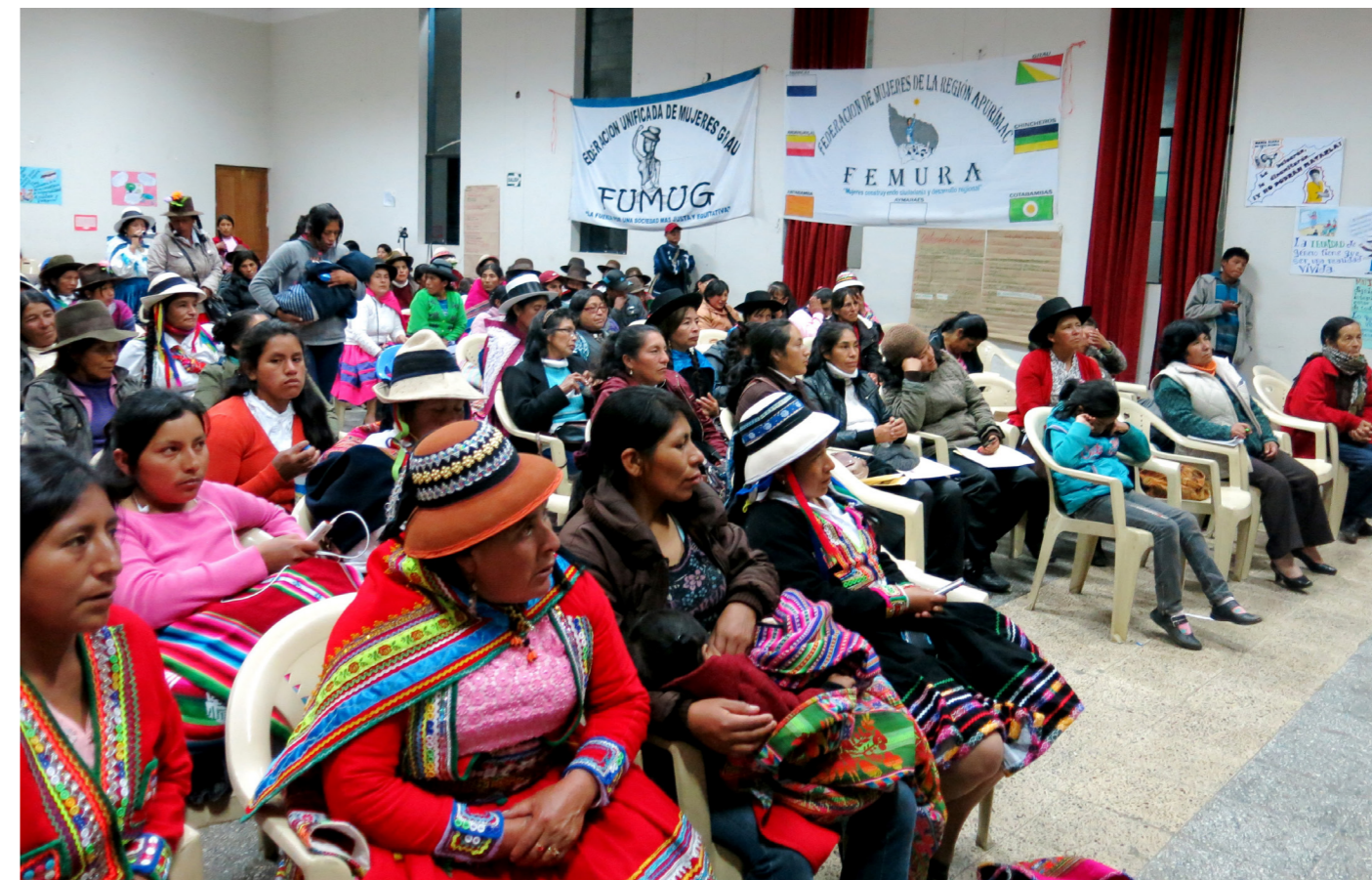
III Congreso Regional de Mujeres, donde se recogió en la agenda de trabajo la lucha contra cualquier tipo de violencia contra la mujer

Conceptos como menstruación o menopausia están contruidos -a menudo por occidente- como un problema al que hay que esconder, un motivo de vergüenza, asco e incluso algo patológico que hay que medicalizar.