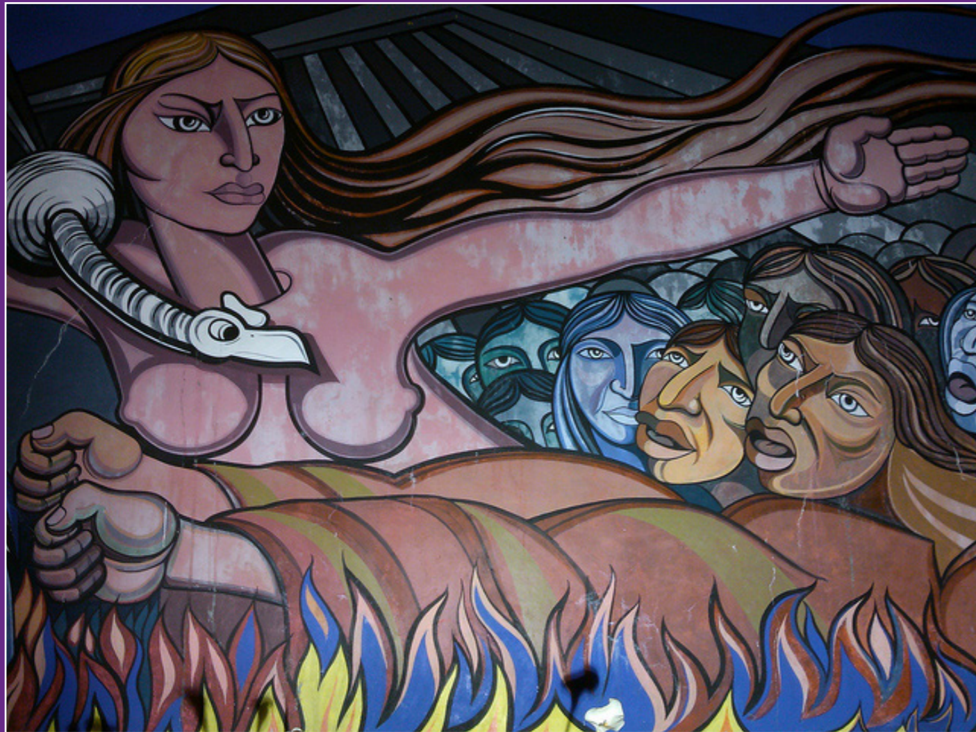
Fragmento de Mural en Plaza Micaela Bastidas en Abancay - Apurímac