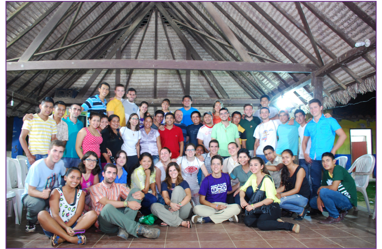
Junto a los universitarios apadrinados

coheres, los números y las letras, se les enseña a reír, a jugar, a abrazar, ya que su situación en casa no