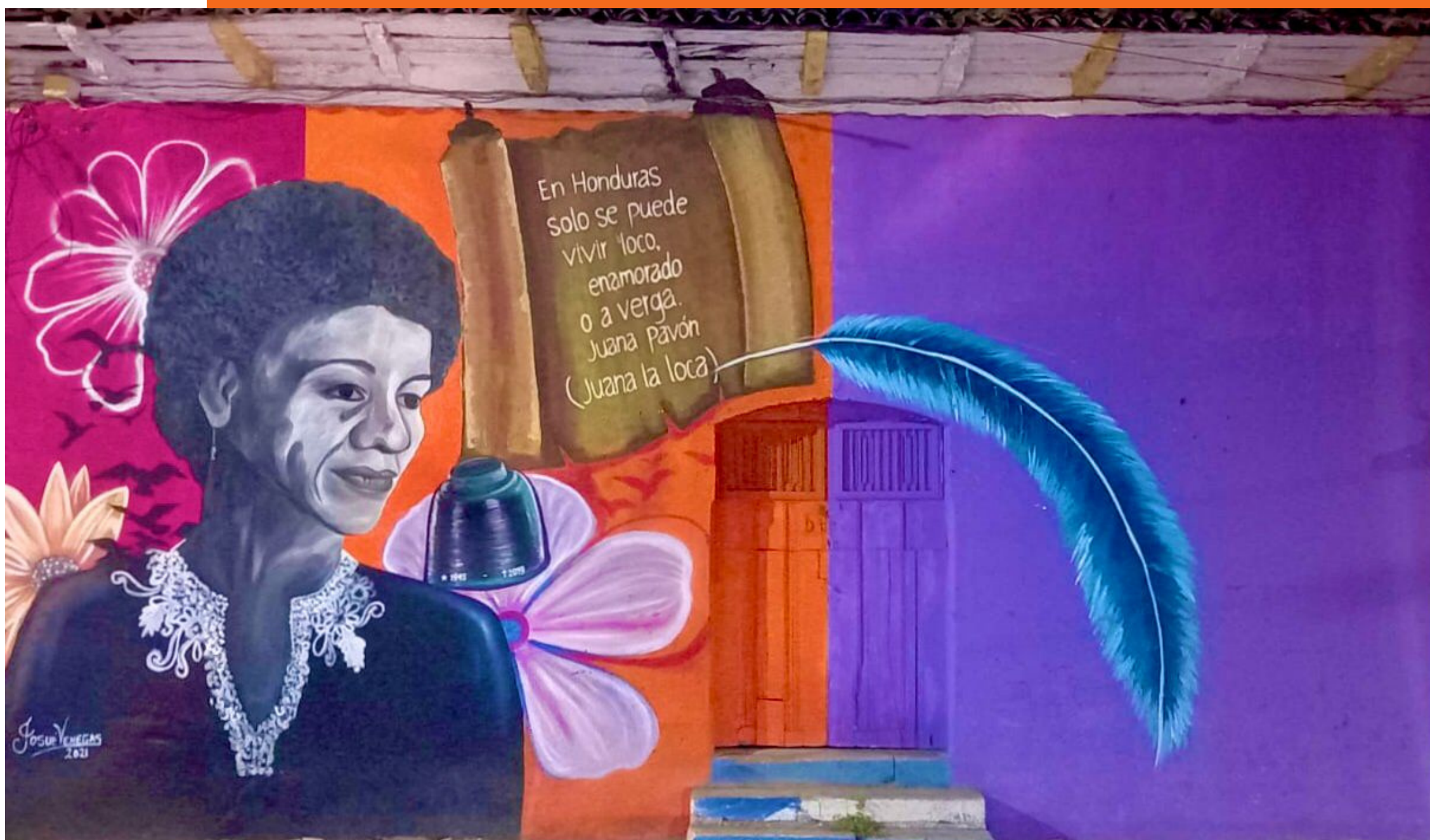
SAN MARCOS DE COLÓN (HONDURAS), 2021

Hemos encontrado por muchos rincones del país numerosos murales con la imagen de Juana Pavón, referente feminista y poetisa hondureña que defendió en cada uno de sus textos los derechos de las mujeres.