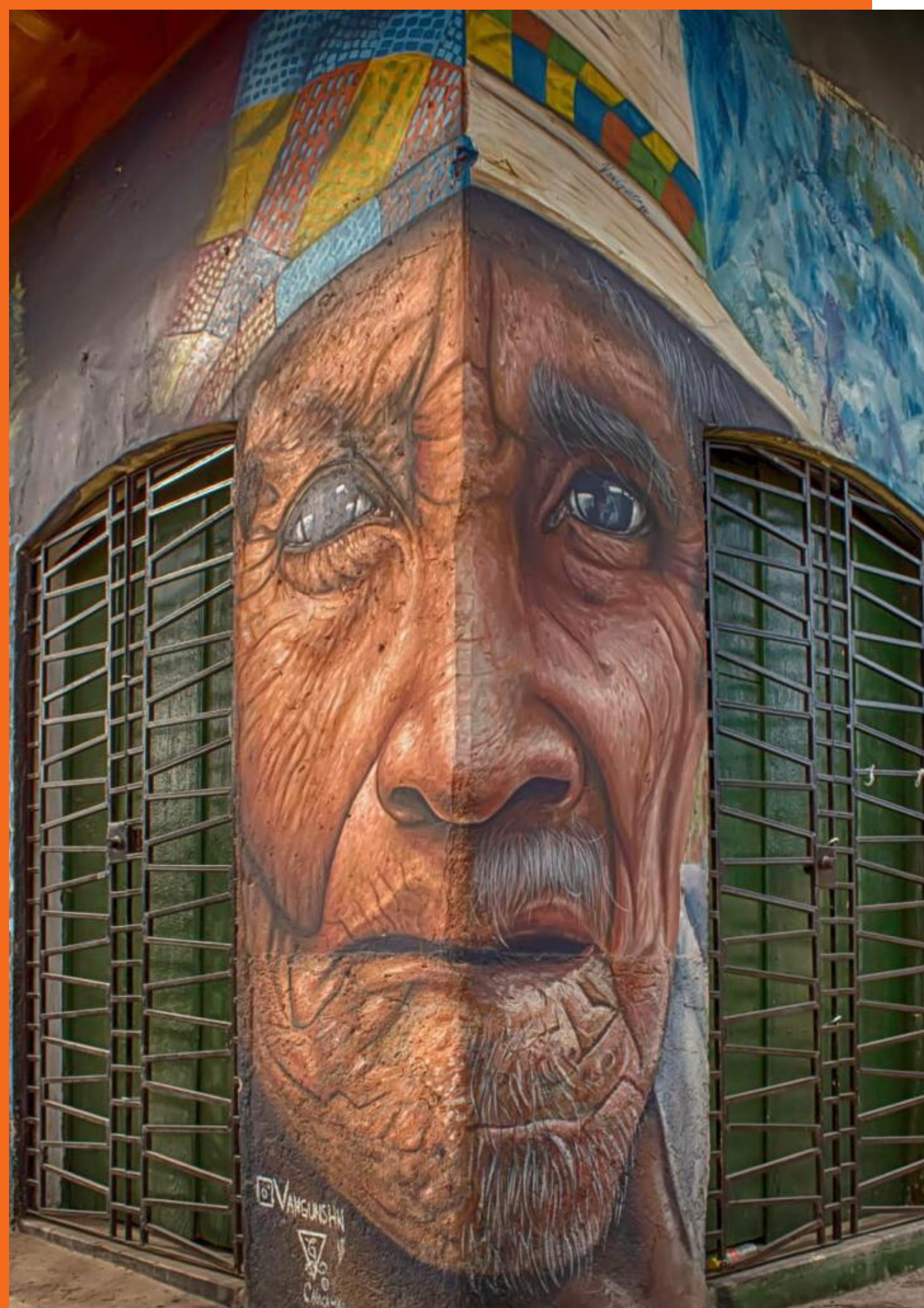
CANTARRANAS (HONDURAS), 2021