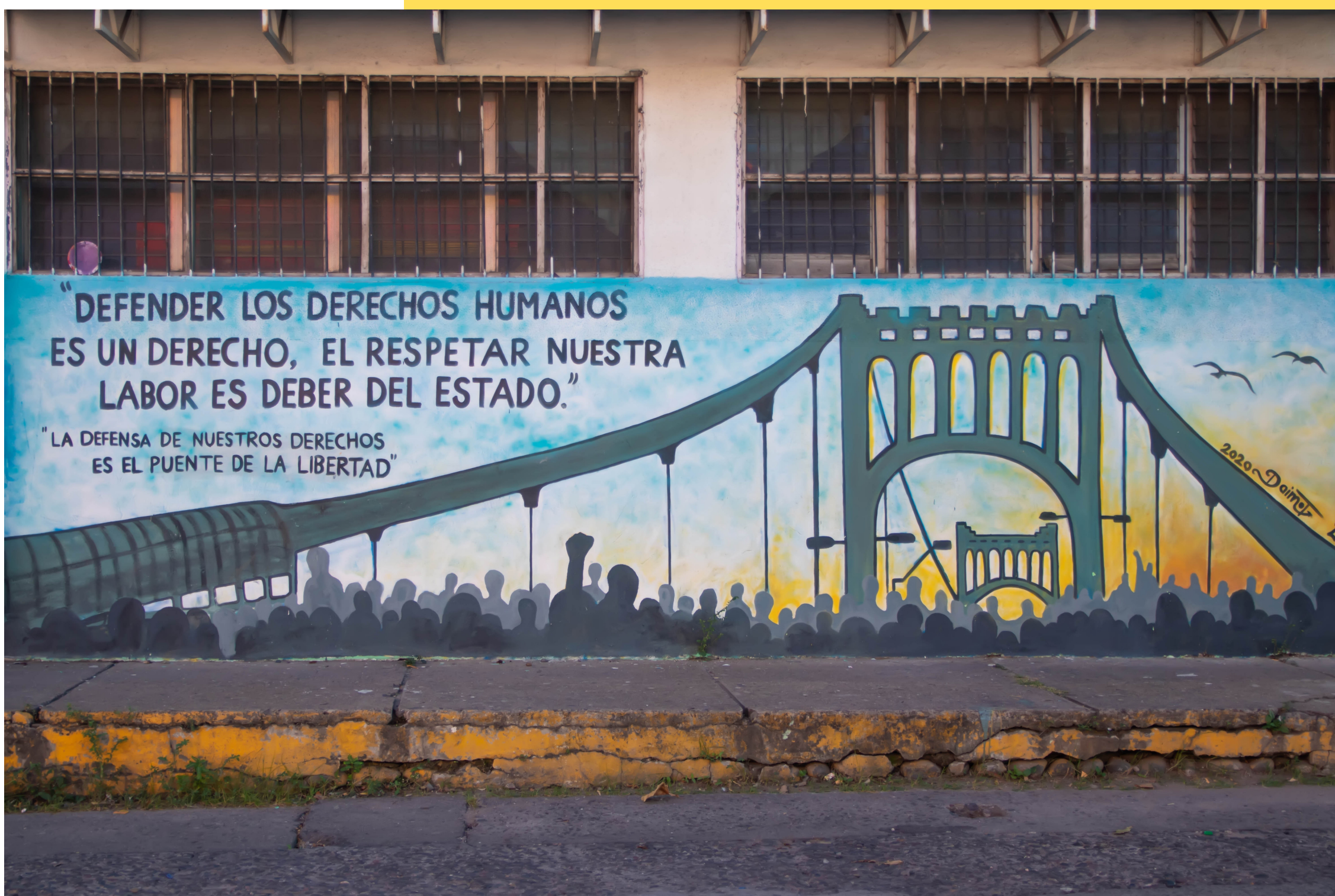
CHOLUTECA (HONDURAS), 2021

Honduras es uno de los países más letales para las defensoras y defensores de los derechos humanos. El asesinato de Berta Cáceres en 2016 por su defensa del derecho a la tierra continúa impune, pero, como se contempla en el mural, se sigue pidiendo justicia. El Estado no deja de obstaculizar esta lucha, persiguiendo a las activistas, deteniendo las investigaciones de crímenes contra ellas y utilizando las herramientas legales a su favor para restringir las libertades y criminalizar a estas personas.