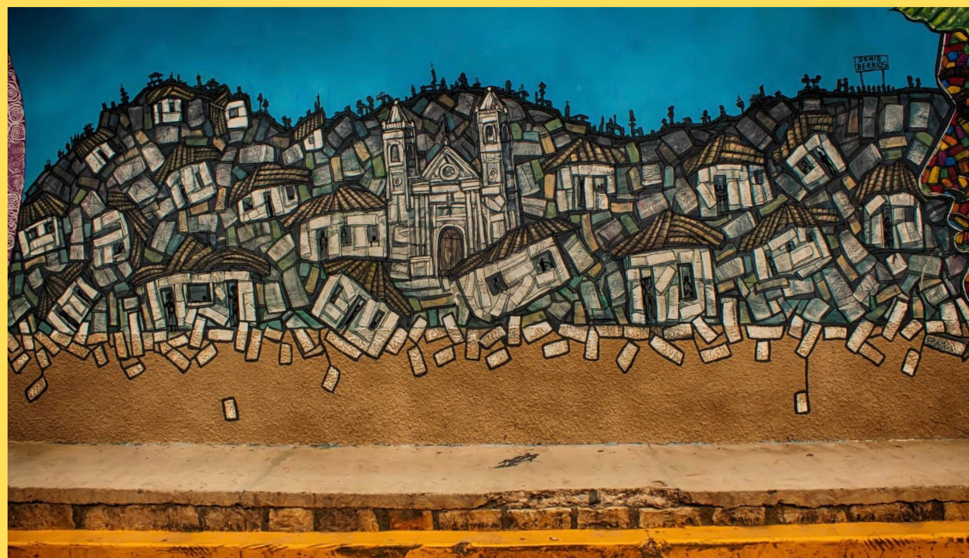
CANTARRANAS (HONDURAS), 2021

Como muestra el mural de la derecha, en la ciudad de Tegucigalpa son comunes los derrumbamientos de casas y colonias enteras durante la estación de lluvias, problema que se repite de forma sistemática año tras año sin ponerle solución.