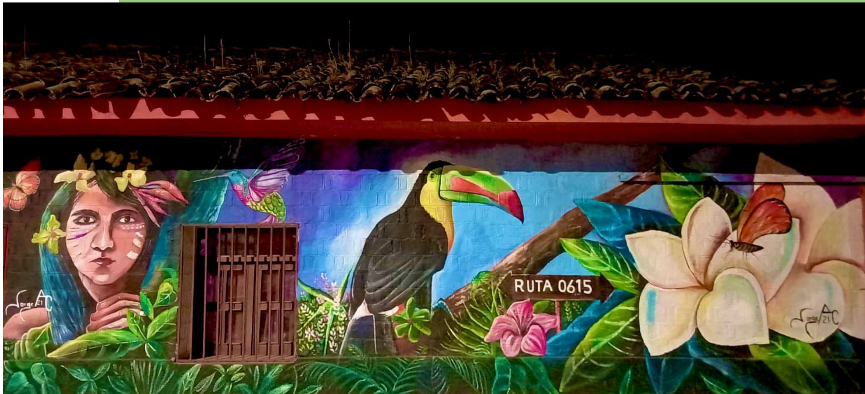
SAN MARCOS DE COLÓN (HONDURAS), 2021

Honduras, como país tropical, tiene una alta diversidad biológica. Tiene más de 10000 especies de plantas y más de 5000 especies animales. Además, como parte del hot spot (ecosistema crítico) mesoamericano, posee un alto porcentaje de endemismo, por lo que su conservación es prioritaria. Así, vemos representada la importancia de la naturaleza y la necesidad de cuidar la interacción que hacemos con ella, en la mayoría de casos nada respetuosa. La sociedad está reclamando la urgencia de poner en valor toda esta riqueza natural, pidiendo a los gobiernos que aboguen por conservarla y no por destruirla, y representando en pinturas como la de arriba la integración del ser humano en el entorno natural, mostrándolo como un todo en el que se creen sinergias y haya una relación armoniosa entre ambas partes.