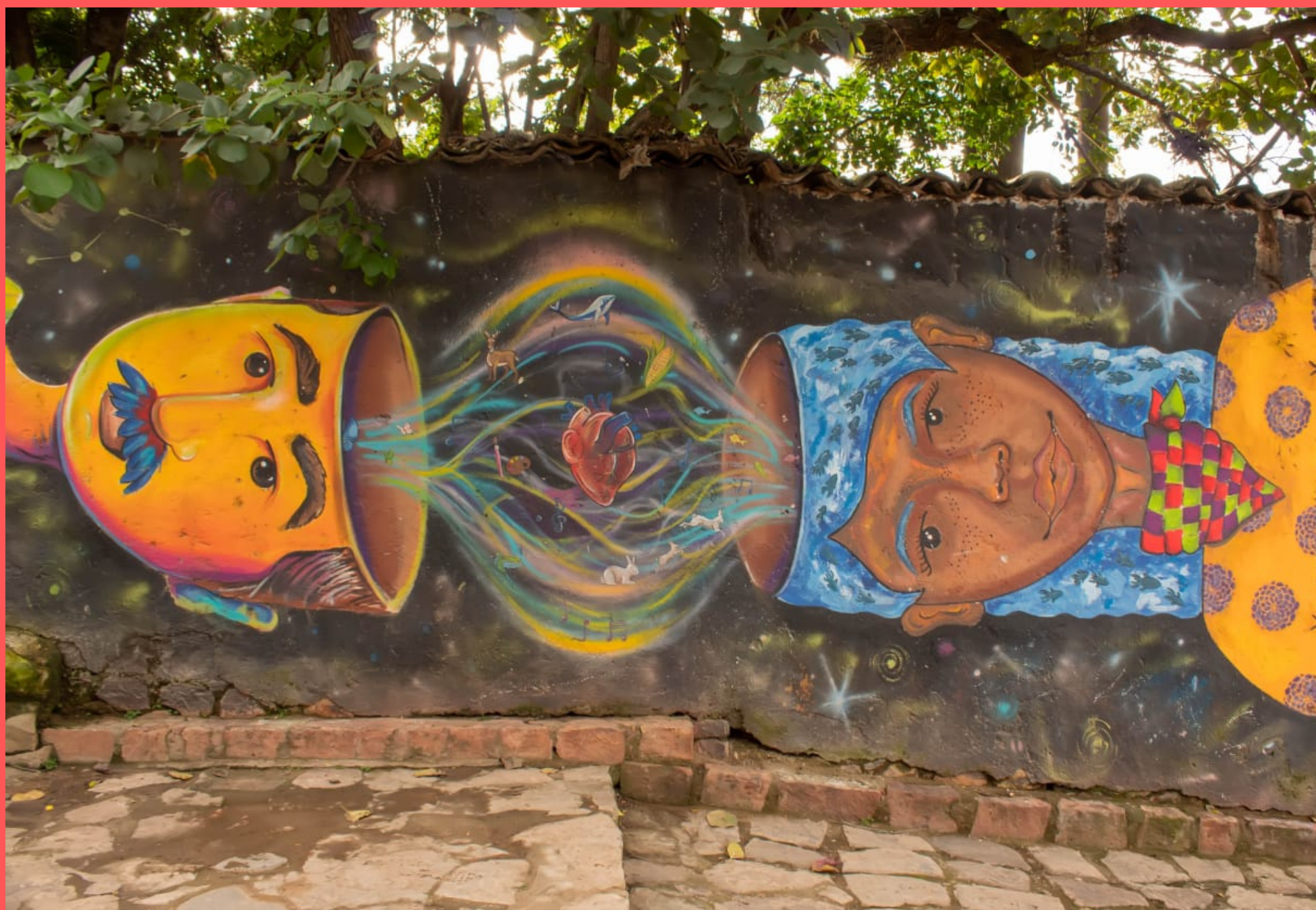
CANTARRANAS (HONDURAS), 2021

Los hondureños y hondureñas no encuentran raíces en un país que les ha privado de ellas, olvidando sus lenguas, sus antepasados y su cultura originaria. Se echa por tierra lo propio al mismo tiempo que se enaltecen lo externo.