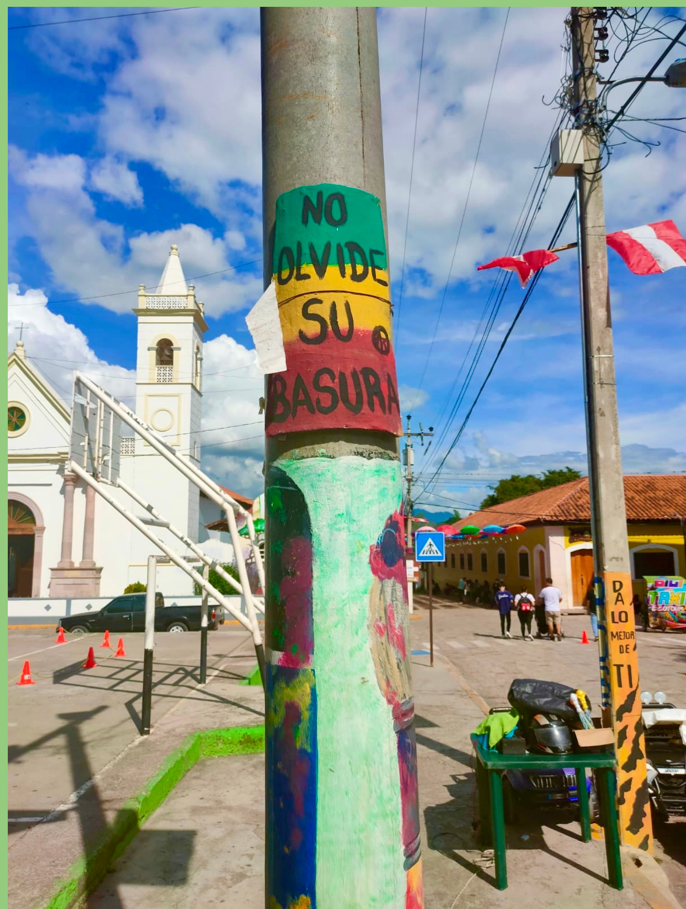
CANTARRANAS (HONDURAS), 2021

Sin embargo, la situación de pobreza es tal que la misma gente pide que se desechen los residuos en las colonias en las que viven para venderlos y obtener así una fuente de ingresos para subsistir, lo cual sigue agudizando, aún más, el problema de contaminación e insalubridad. Todo ello pone de manifiesto la necesidad de implementar políticas públicas que respeten y aseguren los derechos humanos, incidir en la educación ambiental y concienciar sobre la gestión de residuos.