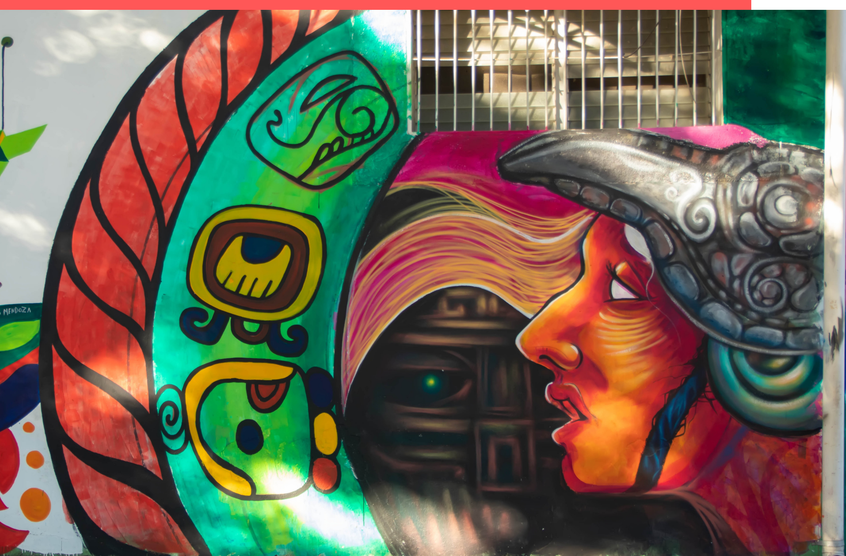
CHOLUTECA (HONDURAS), 2021

No obstante, el país no cuenta con políticas para garantizar y proteger los derechos de estos pueblos. De hecho, las comunidades indígenas viven en zonas rurales de pobreza extrema donde sufren todo tipo de exclusión, como la falta de acceso a servicios básicos, problemas de desnutrición, analfabetismo, inseguridad y falta de respeto por su cultura. De ahí, la necesidad de reivindicar sus orígenes, representando sus referencias culturales en murales como el que vemos a la izquierda, para ponerlo en valor y evitar que se siga discriminando o que caiga en el olvido.