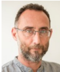
Moderación : Corresponsal de El País basado en Dakar (España/Senegal)